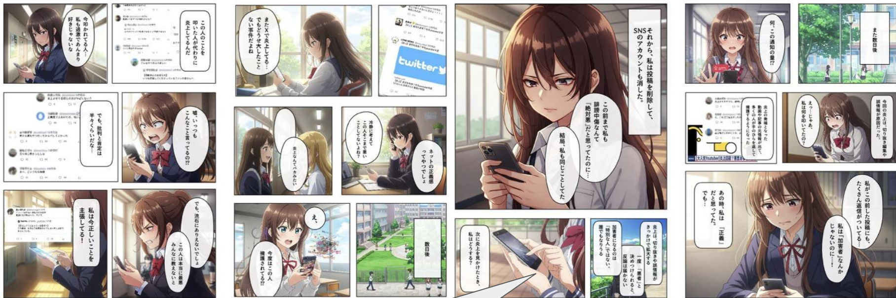
炎上に至る過程の心理描写